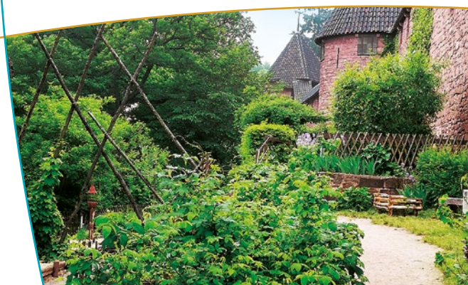
Le petit jardin du château